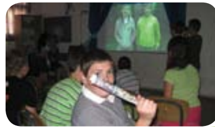
הקרנת תוצרי הפקה של תלמידי ביה"ס