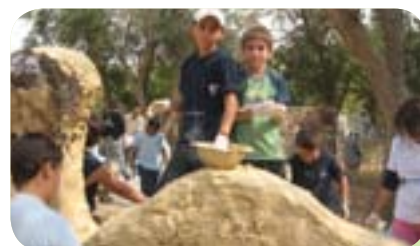
פיסול סביבתי ביום אומן