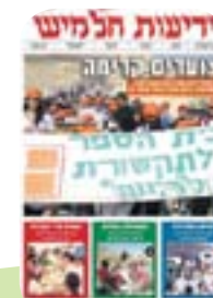
עיתון "חלמיש" המציג את תוצרי הכתיבה הקרנת תוצרי הפקה של תלמידי ביה"ס