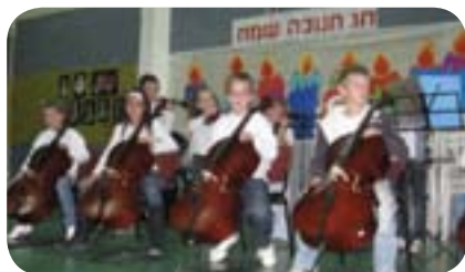
הופעת התלמידים בחנוכה