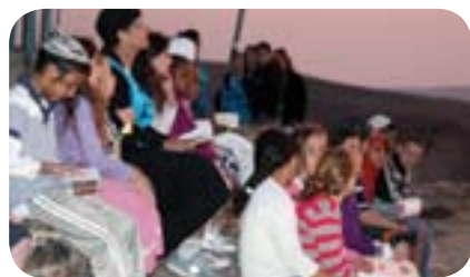
אירוע סליחות בזריחה אלול תשע"א