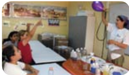
פעילות העשרה מכון ויצמן למדע