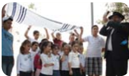
פתיחת שנת הלימודים תשע"ב

התקשורת צריכה להיות לא רק גורם קולקטיבי מתסיס ותעמולני, אלא גם אחד המאגד את ההמונים.