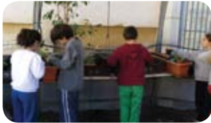
פעילות חקר בגינת בית הספר

בית ספר "אבישור" מאפשר לתלמידיו נגישות לעולם המדעים והטכנולוגיה, כחלק אינטגרלי מתוכנית הלימודים הבית ספרית. התלמיד נחשף לסביבה המזמנת התנסויות מגוונות בתחומי המדע, למידת חקר עצמאית, למידת אסטרטגיות חשיבה, תוך העמדת אתגרים המותאמים ליכולת התלמיד. אנו מאמינים כי באמצעות כלים אלו, ניתן לטפח אצל התלמיד את הסקרנות הטבעית, פתרון בעיות באופן יצירתי, עבודת צוות וחשיבה לוגית. בבית הספר יחווה התלמיד חוויה של יצירה ודמיון בלימודי הרובוטיקה, יפתח גמישות חשיבה דרך משחקי אסטרטגיה, יישם יסודות מדעיים בכלים טכנולוגיים, תוך התנסות בבניית ערכות המדגימות את הנלמד, יחקור את תחום הצומח בגינת החקר, ישאל שאלות, יעלה השערות יאסוף מידע וינתח ואת ממצאיו עד להצגת תוצר סופי. בבית הספר אווירה חמה ומכילה המחזקת אצל התלמיד את תחושת השייכות. צוות המורים מאמין בדיאלוג פתוח ומעצים עם התלמיד והוריו. בכל דור ודור צריך ללמוד את דרכי השימוש בכלים המשפיעים על הדור (הרב קוק)