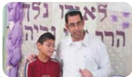
קיוסק המעשים הטובים - כסליו תשע"ב