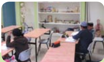
למידה במעבדת המדעים