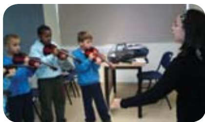
שיעור נגינה בכינור