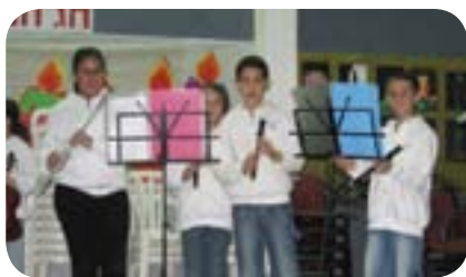
הופעת התלמידים בחנוכה

המוסיקה הינה "שפה" המקדמת ומשכללת מיומנויות חברתיות ולימודיות, ומאפשרת ביטויים גרשיים, אישיים ויצירתיים. היא מטיבה לחבר ולקשר בין התלמיד לסביבתו הקרובה, לתרבותו ולהוויתו הישראלית. הטמעת תוכנית הלימודים במוסיקה כאורח חיים, הינה חלק מתרבות ביה"ס ומשולבת בתוכנית הלימודים של משרד החינוך. המוסיקה נוגעת ברגש ובנפש, היא ראי לעולם הרגשי של הלומד. היא מאפשרת לתלמיד לשכלל את דרכי הביטוי הרגשיות שלו, מפתחת ביטחון ודימוי עצמי חיובי ונוסכת רוגע. ניתן דגש לשימוש במוסיקה ככלי חינוכי להעצמת התלמידים והכוונתם לצמיחה אישית ומיצוי היכולות. כל תלמידי ביה"ס לומדים נגינה על כלי נשיפה, קשת והקשה, ע"י מורים מקצועיים בייעוץ מנהל הקונסרבטוריון. בביה"ס קיימים מקהלה ווקאלית, שיעורי שירה ארץ ישראלית ופיתוח קול. תלמידי בית הספר מופיעים בשירה ונגינה באירועים מגוונים הן בביה"ס והן בקהילה. "המוסיקה היא שפת העולם שאינה צריכה תרגום..." (בסט הולד אורבך)