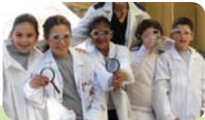
יום המדענים - פורים